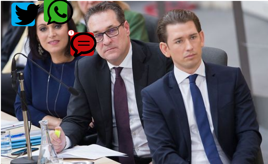
©östinger, Strache, Kurz

eine Reihe "zwingender unionsrechtlicher Bestimmungen". Erhebliche Verwaltungskosten und das Nachholen von Kindern